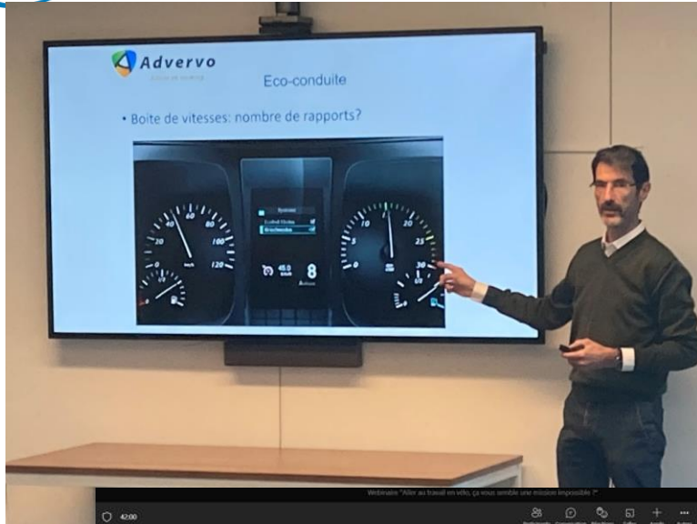
Formation à l'éco-conduite AGC