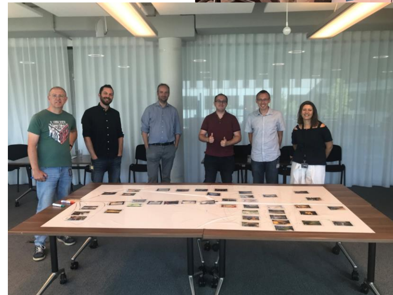
Fresque du climat AGC

23/09/2022 ► Retour sur la Semaine de la Mobilité