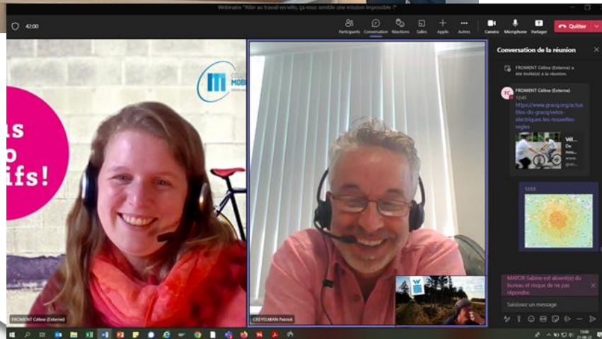
Formation Clichés du vélo SWDE

23/09/2022 ► Retour sur la Semaine de la Mobilité