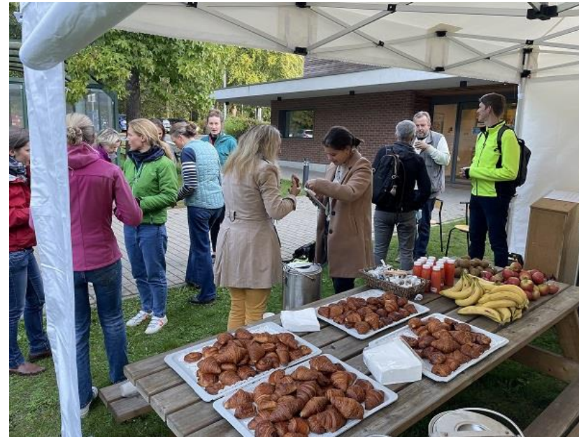
Centre hospitalier neurologique William Lennox