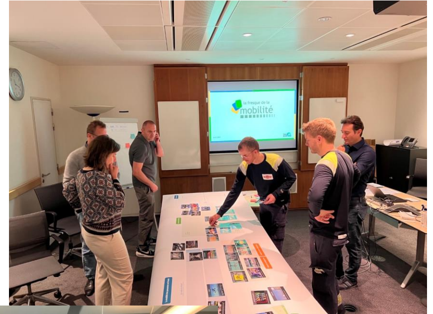
Fresque de la Mobilité Dow